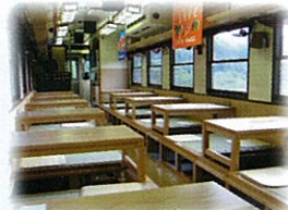
お座敷列車(指定席)ご利用のお客様に「さんりくしおかぜ」ポストカードプレゼント!

■運行期間 7月31日・8月1日・7日・8日・14日・15日 ■普通片道運賃 [宮古-久慈間] 1,800円